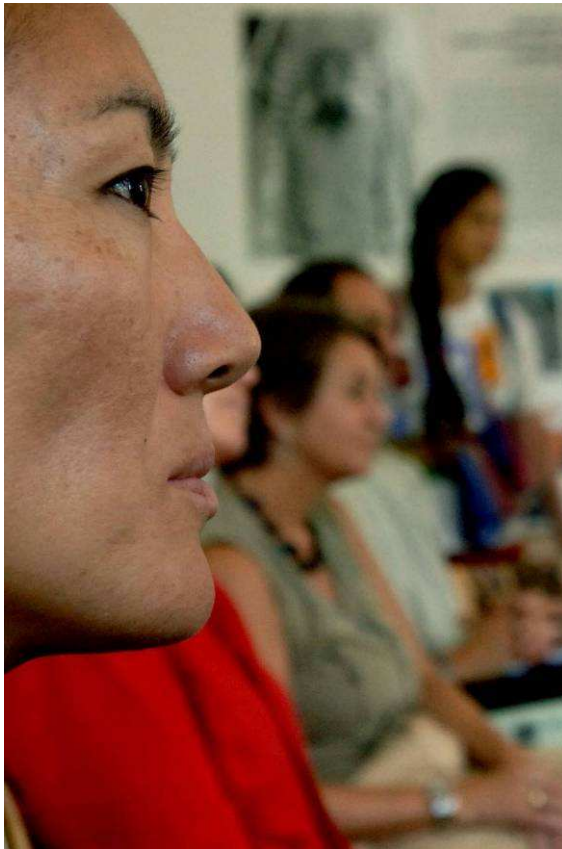
Gemeinsam Zukunft einüben im HSA - Kurs Dialog der Kulturen

FA=Freiwilligenarbeit, KL=externe Kursleitung, EF=externe Fachpersonen, Zivi=Zivildienstleistender