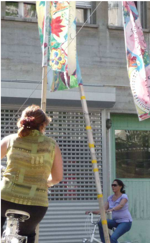
Velofahrkurs für Frauen

FA=Freiwilligenarbeit, KL=externe Kursleitung, EF=externe Fachpersonen, Zivi=Zivildienstleistender