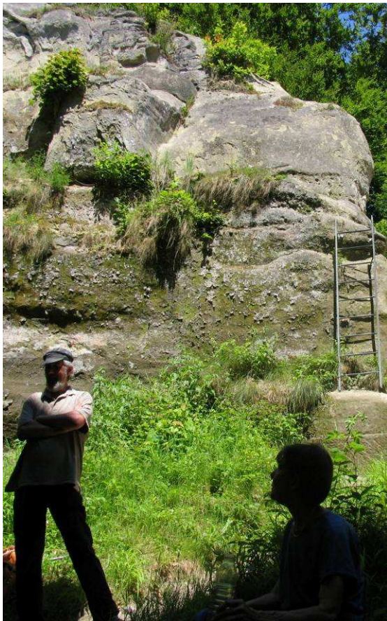
Exkursion im Röstigraben, Grasburg

info@haus-der-religionen.ch www.haus-der-religionen.ch