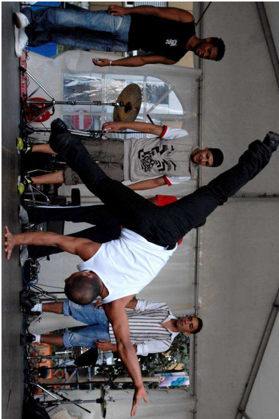
Besser nicht die Wand hoch

FA=Freiwilligenarbeit, KL=externe Kursleitung, EF=externe Fachpersonen, Zivi=Zivildienstleistender