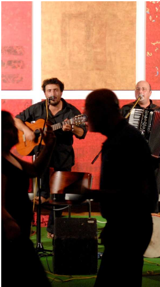
Grossinstallation „Magisches Quadrat“ Musik und Tanz der Kulturen