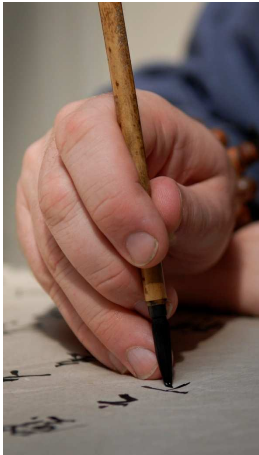
Kalligrafie – Kunst der schönen Schrift

FA=Freiwilligenarbeit, KL=externe Kursleitung, EF=externe Fachpersonen, Zivi=Zivildienstleistender